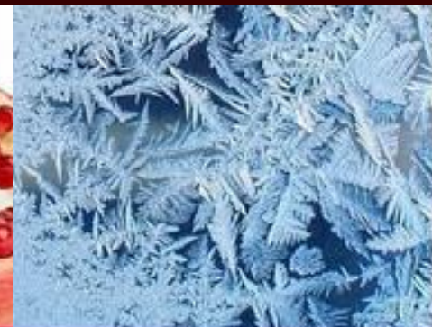
BOTOX EFFECT ALGINATE MASK Argireline—Myorelaxing