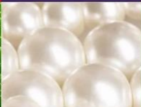
MOISTURIZING AND LIFTING RICH ALGINATE MASK Imperial Pearl Extract