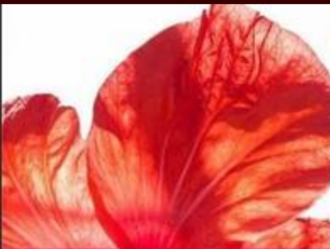
LIFTING COLLAGEN ALGINATE MASK Natural Sudan Rose extract