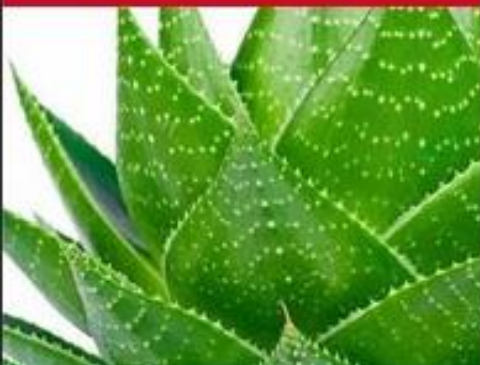
HYDRATION AND RECOVERY ALGINATE MASK Natural Aloe Vera Extract