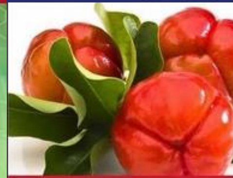
REJUVENATION AND NUTRITION ALGINATE MASK Natural Acerola Extract