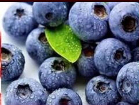
VITAMIN-BURST ALGINATE MASK Blueberry—Vitamin C