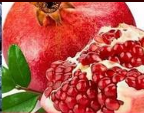
ANTI-WRINKLE AND STIMULATING ALGINATE MASK Garnet—Vitamin C