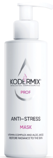
Форма выпуска: флакон с дозатором 200 мл

Маска Антистресс устраняет последствия воздействия негативных факторов на кожу. Мультиактивный комплекс KoderMIX™ восстанавливает структуру и поддерживает функции рогового слоя, предупреждает процессы окисления. Витаминный комплекс (A, E, C, F, B, PP) тонизирует кожу, придает ей здоровый внешний вид. PatchH 2 O® обеспечивает пролонгированную гидратацию всех слоев эпидермиса. Экстракты куркумы и алоэ нормализуют себывыделение, сужают поры, обладают бактерицидными свойствами, повышают местный иммунитет. Сок алоэ стимулирует выработку коллагена и гиалуроновой кислоты.