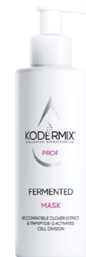
Форма выпуска: флакон с дозатором 200 мл

МЕРЫ ПРЕДОСТОРОЖНОСТИ: для наружного применения. Не наносить на поврежденную кожу и при индивидуальной непереносимости. При попадании в глаза промыть водой.