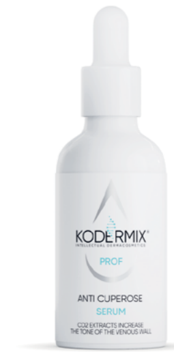
Форма выпуска: флакон с капельницей 50 мл

Антикуперозная сыворотка для лица уменьшает сосудистую сетку, выравнивает тон кожи. Мультиактивный комплекс KoderMIX ™ интенсивно восстанавливает структуру и поддерживает функции рогового слоя, предупреждает процессы окисления. Увлажняющий комплекс PatchH 2 O ® обеспечивает гидратацию всех слоев эпидермиса. Экстракты центеллы и ромашки с витамином B5 и аллантоином снимают кожные раздражения. Экстракт конского каштана устраняет венозный застой, уменьшает проницаемость и ломкость капилляров. Экстракт сирени стимулирует клетки к восстановлению, обладает антиоксидантным и себорегулирующим действиями. Экстракт солодки нормализует водно-солевой баланс в глубоких слоях дермы.