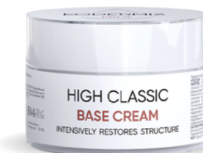
Форма выпуска: банка 50 мл/флакон с дозатором 200 мл

МЕРЫ ПРЕДОСТОРОЖНОСТИ: для наружного применения. Не наносить на поврежденную кожу и при индивидуальной непереносимости. При попадании в глаза промыть водой.