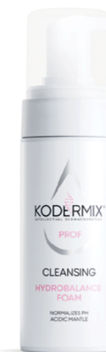
Форма выпуска: флакон с дозатором 150 мл

Пенка-гидробаланс эффективно удаляет омертвевшие клетки, очищает и сужает поры, стимулирует обновление верхних слоев эпидермиса, сокращает мелкие морщинки, выравнивает микрорельеф дермы. Глюконолактон усиливает защитные свойства кожи, нормализует pH кислотной мантии, укрепляет волокна эластина и коллагена, предотвращает гликацию белковых волокон. Инновационный увлажняющий компонент Patch 2 O ® обеспечивает пролонгированную гидратацию дермы, защищает от негативного влияния окружающей среды. Экстракт опунции восстанавливает естественный водный баланс. Экстракт сакуры снимает отечность, осветляет кожу, борется с пигментацией. Экстракт лотоса оказывает лифтинг-эффект, активизирует обменные процессы, подавляет активность микроорганизмов.