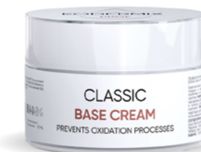
Форма выпуска: банка 50 мл/флакон с дозатором 200 мл

МЕРЫ ПРЕДОСТОРОЖНОСТИ: для наружного применения. Не наносить на поврежденную кожу и при индивидуальной непереносимости. При попадании в глаза промыть водой.