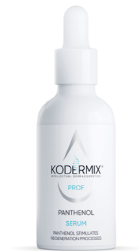
Форма выпуска: флакон с капельницей 50 мл

Сыворотка для лица с пантенолом восстанавливает кожу после агрессивных воздействий, стимулирует процессы регенерации. Увлажняющий комплекс PatchH 2 O ® обеспечивает пролонгированную гидратацию всех слоев эпидермиса. Мультиактивный комплекс KoderMIX ™ интенсивно восстанавливает структуру и поддерживает функции рогового слоя, предупреждает процессы окисления. Д-Пантенол в сочетании с экстрактом ромашки интенсивно увлажняют кожу и способствуют устранению сухости и микротрещин.