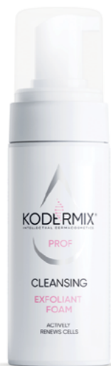
Форма выпуска: флакон с дозатором 150 мл

Пенка-эксфолиант предназначена для деликатного, глубокого очищения от загрязнений и макияжа. Сужает поры, растворяет и удаляет омертвевшие клетки эпидермиса, нормализует себорегуляцию, повышает тонус кожи, придает свежесть и сияние. Комплекс АНА-кислот (яблочная, янтарная, винная) стимулирует клетки к активному обновлению, проявляет антиоксидантные защитные свойства, придает тонус и упругость, выравнивает тон и микрорельеф кожи. Инновационный увлажняющий компонент Patch 2 O ® обеспечивает пролонгированную гидратацию дермы, защищает от негативного влияния окружающей среды. Экстракт моринды обладает регенерирующим действием. Экстракт томата повышает защитные свойства кожи и укрепляет стенки капилляров. Экстракт морозки обладает заживляющим, очищающим и противовоспалительным свойством.