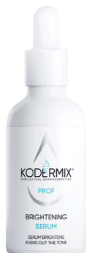
Форма выпуска: флакон с капельницей 50 мл

Сыворотка для лица выравнивает и осветляет тон кожи. Высокостабильная форма витамина С глубоко проникает в кожу, предотвращает окислительные процессы и стимулирует синтез коллагена. Увлажняющий комплекс PatchH 2 O ® обеспечивает пролонгированную гидратацию всех слоев эпидермиса. Мультиактивный комплекс KoderMIX ™ восстанавливает структуру и поддерживает функции рогового слоя, предупреждает процессы окисления. Экстракты куркумы и алоэ стимулируют местный иммунитет, нормализуют выработку себума, сужают поры. Активный комплекс из коры дуба улучшает лимфоциркуляцию, снимает раздражение. Экстракты солодки и василька нормализуют водно-солевой обмен, уменьшают отечность и укрепляют сосуды.