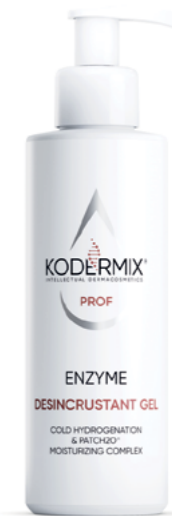
Форма выпуска: флакон с дозатором 200/400 мл

МЕРЫ ПРЕДОСТОРОЖНОСТИ: может вызывать жжение и покалывание. Для наружного применения. Не наносить на поврежденную кожу и при индивидуальной непереносимости. При попадании в глаза промыть водой.