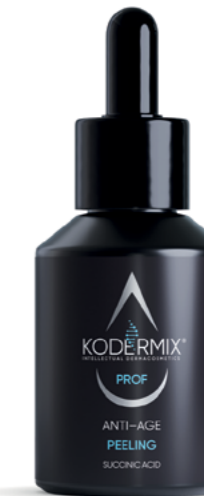
Форма выпуска: флакон с капельницей 50 мл

Anti-age peeling & succinic acid, 7,0%, pH = 3,0