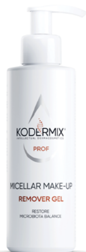
Форма выпуска: флакон с дозатором 200 мл

Мицеллярный гель с пребиотиками деликатно очищает кожу от загрязнений и макияжа, не повреждая естественную гидролипидную мантию, поддерживает необходимый уровень увлажненности кожи. Наличие пребиотиков в составе, способствует восстановлению баланса микробиоты кожи. Инновационный увлажняющий компонент PatchH 2 O ® обеспечивает пролонгированную гидратацию дермы, защищает от негативного влияния окружающей среды. Комплекс растительных экстрактов ( льна , календулы , центеллы азиатской ) оказывает защитное действие, улучшает цвет лица и эластичность кожи. Экстракт молока выравнивает естественный тон лица.