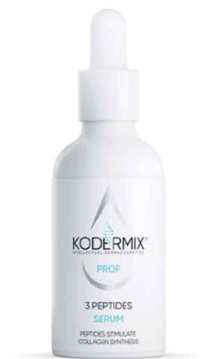
Форма выпуска: флакон с капельницей 50 мл

Сыворотка для лица с пептидами выравнивает микрорельеф кожи и оказывает выраженный антивозрастной эффект. Увлажняющий комплекс PatchH 2 O ® обеспечивает гидратацию всех слоев эпидермиса. Мультиактивный комплекс KoderMIX ™ интенсивно восстанавливает структуру рогового слоя. Трипептид F3Acetyl Tripeptide-2 уменьшает птоз, биопептиды CL и EL стимулируют синтез коллагена, эластина и гликозаминогликанов, уплотняя кожу и уменьшая морщины. Аминокислотный комплекс выводит токсины. Экстракт борago очищает кожу от угревой сыпи и регулирует выделение себума.