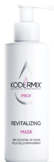
Форма выпуска: флакон с дозатором 200 мл

Маска для лица с морскими экстрактами обладает дренажным, тонизирующим, омолаживающим эффектом, устраняет отечность, серый цвет лица. Комплекс экстрактов красных, бурых и сине-голубых водорослей глубоко питает и увлажняет кожу, восстанавливает эластичность, стимулирует синтез коллагена и эластина, оказывает омолаживающее действие. Увлажняющий комплекс PatchH 2 O® обеспечивает пролонгированную гидратацию всех слоев эпидермиса. Мультиактивный комплекс KoderMIX™ восстанавливает структуру и поддерживает функции рогового слоя, предупреждает процессы окисления. Витаминный комплекс тонизирует кожу.