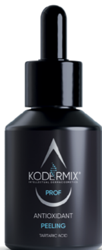
Форма выпуска: флакон с капельницей 50 мл

Antioxidant peeling & tartaric acid, 20,0%, pH = 3,0