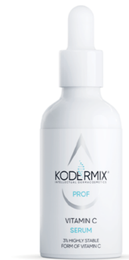
Форма выпуска: флакон с капельницей 50 мл

Сыворотка для лица содержит 3% высокостабильную форму витамина С , выравнивает тон кожи, укрепляет стенки капилляров, стимулирует выработку коллагена. Увлажняющий комплекс PatchH 2 O ® обеспечивает пролонгированную гидратацию всех слоев эпидермиса. Антиоксидантный комплекс экстрактов томата , дикий розы и ягод морoшки защищает клетки от свободных форм кислорода, оказывает интенсивное репаративное, тонизирующее действие. Мультиактивный комплекс KoderMIX ™ восстанавливает структуру и поддерживает функции рогового слоя, предупреждает процессы окисления.